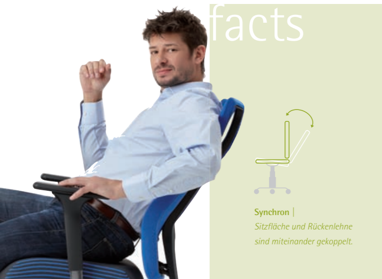
Synchron | Sitzfläche und Rückenlehne sind miteinander gekoppelt.

Mit dem großen Öffnungswinkel ermöglicht die Synchronmechanik z.B. beim vote® so erheblich mehr Sitzkomfort als viele andere Mechaniken. Die spezielle Synchronkopplung sorgt beim Zurücklehnen für einen größeren Öffnungswinkel zwischen Oberkörper und Oberschenkeln. Das kräftigt die Gelenke, streckt den Körper und verbessert die Durchblutung. Der Abstützpunkt des Beckens bleibt erhalten.