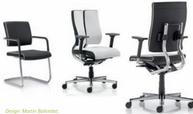
Design: Martin Ballendat