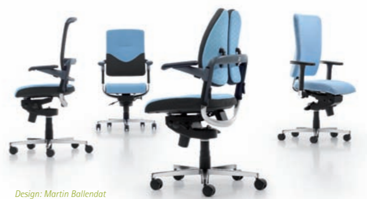
Design: Martin Ballendat