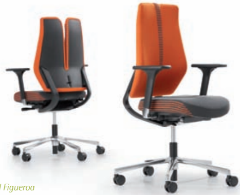
Design: Daniel Figueroa