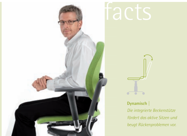
Dynamisch | Die integrierte Beckenstütze fördert das aktive Sitzen und beugt Rückenproblemen vor.

Die dynamische Beckenunterstützung verhindert das Abrollen des Beckens durch den Sitzkeil-Effekt. Die Wirbelsäule bleibt in der optimalen Form und der Rücken wird entlastet. Das Sitzteil ist mit der Bewegung der Rückenlehne synchronisiert und kann in der Tiefe an die Proportionen des Körpers angepasst werden. Beckenunterstützung ist für die xenium® -Familie und den alero® erhältlich.