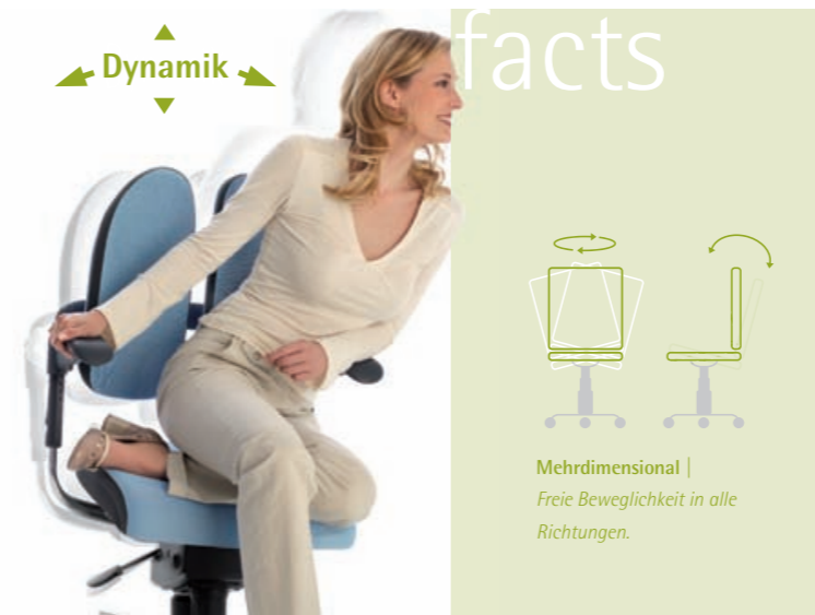
Mehrdimensional | Freie Beweglichkeit in alle Richtungen.

Die freework® -Mechanik bietet einen mehrdimensionalen Bewegungsablauf, der durch ihre körpereigene Motorik gesteuert in horizontale und vertikale Bewegungen umgesetzt wird. Kippeln ausdrücklich erwünscht. Das freework® -Konzept ist für die xenium® -Familie und den alero® erhältlich.